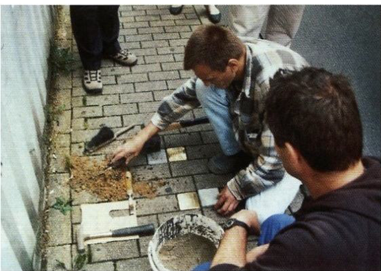
In der Untergrünwalder Straße: Sorgfältig werden die Stolpersteine in die Pflasterung eingefügt.